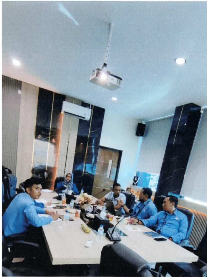
Rapat Koordinasi PPID Pelaksana Senin, 10 Juni 2024 di Ruang Meeting PERUMDAM Tirta Projotamansari