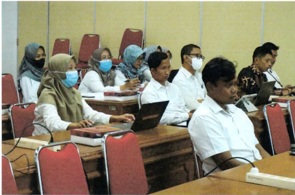
Foto Kegiatan PPID