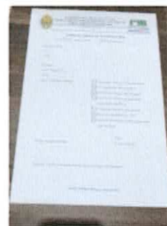
Form Permohonan dan Keberatan (Hardcopy)