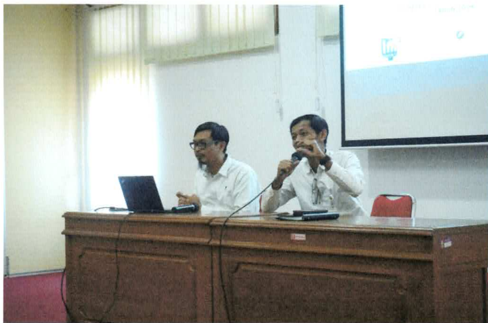
Pendampingan pengisian SAQ oleh Kominfo Rabu, 23 Agustus 2024 di Ruang Rapat Mandala Saba Prasima Gedung Induk Kompleks Parasamya Bantul