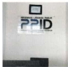
Ruangan/tempat Khusus Layanan Informasi

PLID menyediakan ruang dan meja layanan informasi publik yang dilengkapi dengan perangkat pendukung layanan antara lain, buku tamu, telepon, komputer untuk petugas layanan, printer, kursi tunggu, formulir yang terkait dengan pelaksanaan PLID, dan papan pengumuman/ running text untuk memperlancar pelayanan informasi publik.