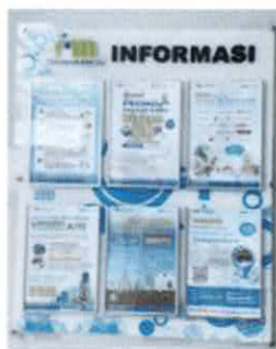
Papan Pengumuman/ Running Text