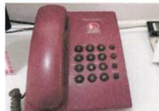
Telepon/Sarana Komunikasi Internal