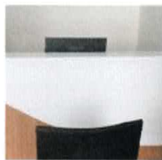
Meja dan Kursi Layanan