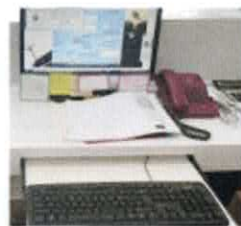
Komputer/alat Elektronik yang dapat diakses langsung pemohon layanan