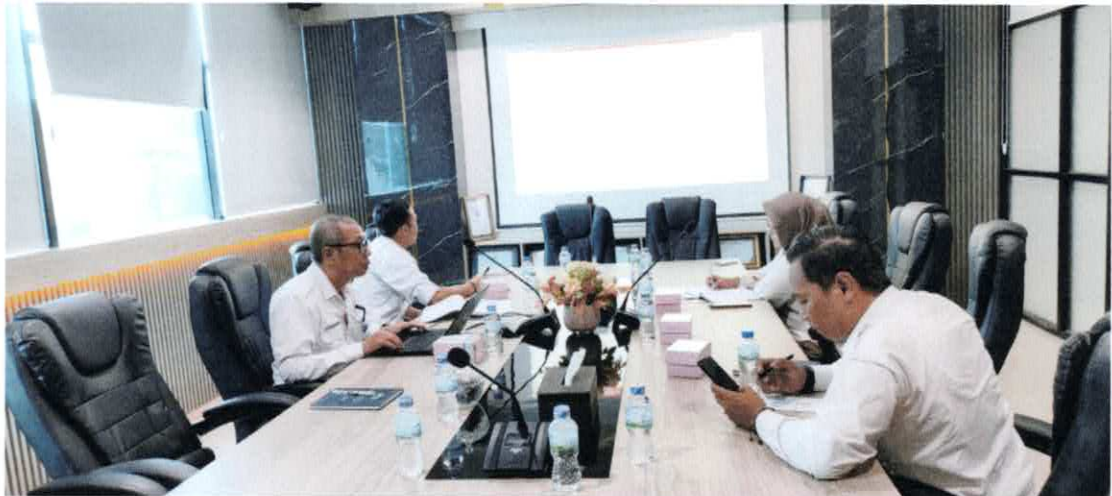
Rapat Koordinasi PPID Pelaksana Rabu, 7 Juli 2024 di Ruang Meeting PERUMDAM Tirta Projotamansari